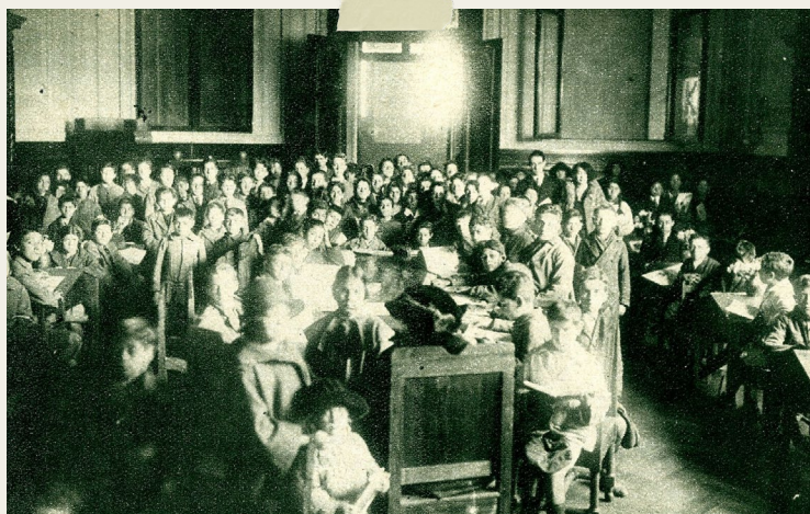
ANTIGUO SALÓN DE LECTURA DE NIÑOS

Una gran novedad del nuevo edificio de la biblioteca, fue el Salón de Lectura de Niños , hecho especialmente para niñas y niños. El salón abrió el 12 de octubre de 1924, cuando la biblioteca estaba todavía en construcción, y fue la primera sala que se inauguró en la nueva Biblioteca Nacional.