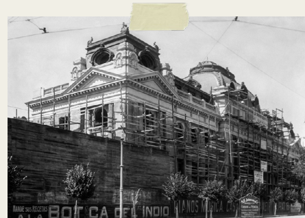
CONSTRUCCIÓN EDIFICIO BIBLIOTECA NACIONAL

La Biblioteca Nacional se fundó en el año 1813, pero estuvo en distintos lugares, hasta que en el año 1913 se empezó a construir su actual hogar, en el centro de Santiago.