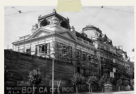
CONSTRUCCIÓN EDIFICIO BIBLIOTECA NACIONAL

La Biblioteca Nacional se fundó en el año 1813, pero estuvo en distintos lugares, hasta que en el año 1913 se empezó a construir su actual hogar, en el centro de Santiago.