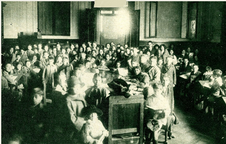
ANTIGUO SALÓN DE LECTURA DE NIÑOS

Una gran novedad del nuevo edificio de la biblioteca, fue el Salón de Lectura de Niños , hecho especialmente para niñas y niños. El salón abrió el 12 de octubre de 1924, cuando la biblioteca estaba todavía en construcción, y fue la primera sala que se inauguró en la nueva Biblioteca Nacional.