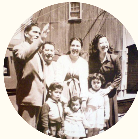
Familia chilena, 1945.

Derecho a que una familia me cuide y me quiera.