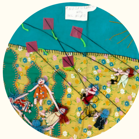
Arpillera, Año Internacional del Niño