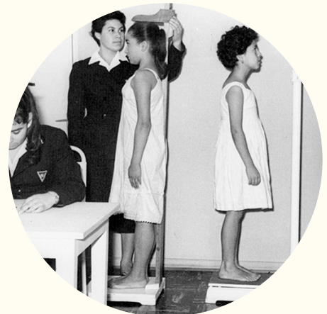
Control de salud de estudiantes. 1947.

Derecho a ser protegido y a estar entre los primeros en recibir ayuda en cualquier circunstancia.