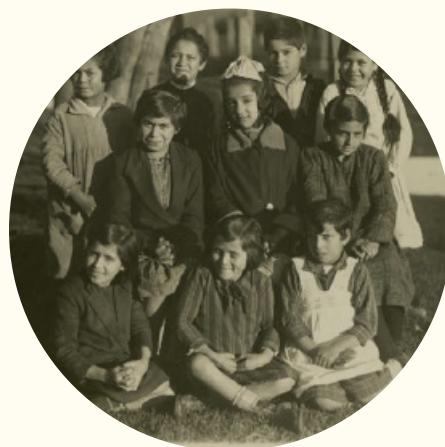
Estudiantes Escuela Meiseta N° 59 de Talcahuano, 1920.

Derecho a jugar, descansar y divertirme en un ambiente sano.