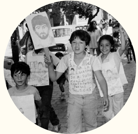
Protesta infantil por los Derechos Humanos.

Derecho a expresar mis ideas, a ser escuchado y a que mi opinión sea tomada en cuenta.