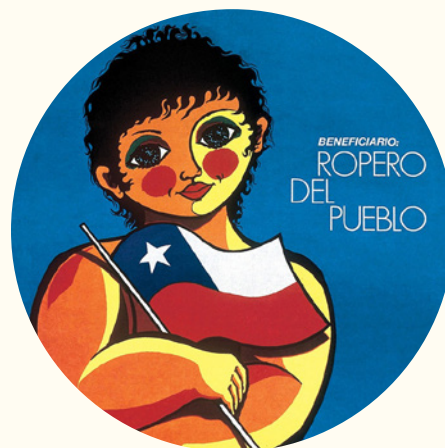
Afiche de Waldo González, 1971.