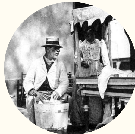
Heladero en Santiago, hacia 1901.