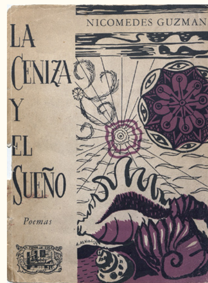
Portada de la segunda edición de La ceniza y el sueño (1960), primer libro de Nicomedes Guzmán.

*Para Nicomedes era muy importante contar la verdad sobre la vida de las personas, para así lograr la paz y el entendimiento. Como escribe en su libro La Sangre y la Esperanza : “Era la vida, era su rudeza y eran sus compensaciones”.