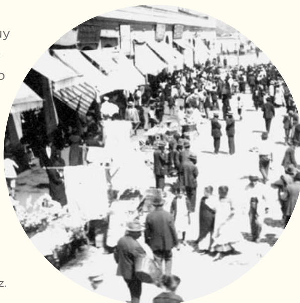
Mercado central en el Barrio Mapocho, en 1950.