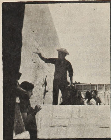
MATTA DIBUJA; LOS JOVENES DE LA BRP OBSERVAN. EL FAMOSO PINTOR HIZO EL MODELO ORIGINAL, PERO DEJANDO ENTERA LIBERTAD A LOS MUCHACHOS PARA APORTAR IDEAS.