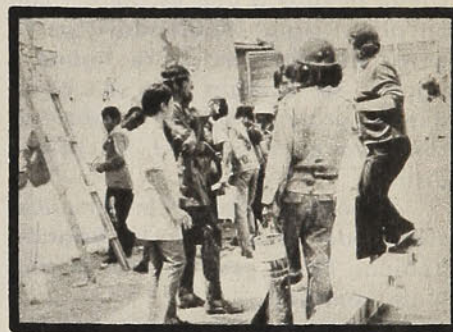
FIESTA CREADORA EN LA GRANJA. EL MURAL VA TOMANDO FORMA DEFINITIVA. MATTA ES FELIZ DE COLABORAR CON LA BRIGADA RAMONA PARRA. "BASTA DE MUSEOS CERRADOS. EL ARTE A LA CALLE."

L A piscina municipal de La Granja se encuentra en el paradero 25 de Santa Rosa. Al fondo, para limitar el terreno, un gran muro de 100 metros cuadrados despertaba el apetito de las Brigadas Ramona Parra. Hace dos semanas, una mañana con muchísimo sol, llegó hasta la piscina un camión con 15 jóvenes, tarros de pintura, brochas y algunas bebidas.