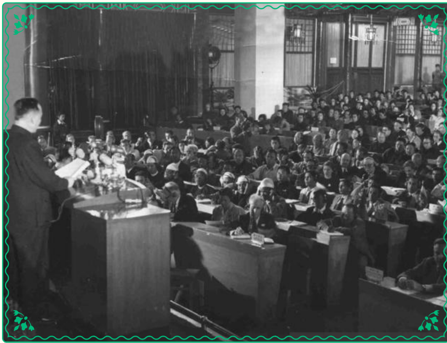
Fernando Santiván en el Congreso de la Paz, China, 1952.