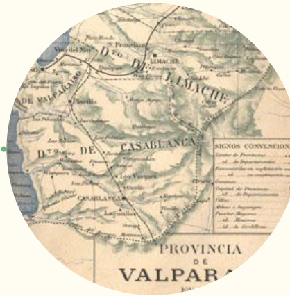
Mapa de la Provincia de Valparaíso, hacia 1885 .

27 de octubre. Por Ley se declara la provincia de Valparaíso .