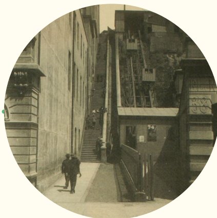
Ascensor Cordillera, hacia 1900.

1 de diciembre. Se inaugura el primer ascensor de Valparaíso, en el cerro Concepción. Le siguió el ascensor del cerro Cordillera, inaugurado en 1887.