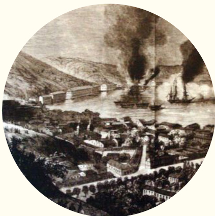
Ilustración del bombardeo al puerto de Valparaíso.

31 de marzo. Valparaíso es bombardeado por la Escuadra Española, como consecuencia de la guerra entre Chile y España (1865 -1866).