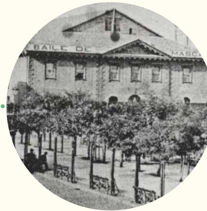
Primer Teatro Victoria , fecha desconocida.

16 de diciembre. El primer teatro Victoria de Valparaíso abre sus puertas.