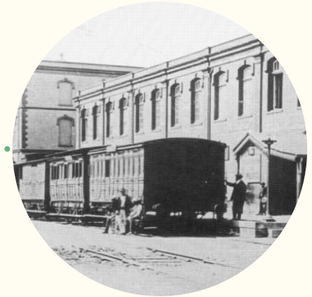
Ferrocarril en la calle Errázuriz, hacia 1860.

14 de septiembre. Se inaugura el ferrocarril Valparaíso-Santiago.