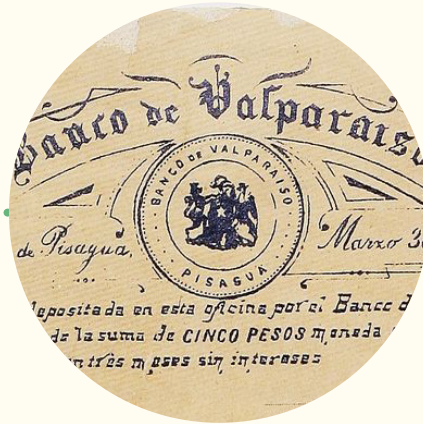
Vale de depósito del Banco de Valparaíso, 1891.

Octubre. Se funda la primera institución bancaria en Chile: El Banco de Valparaíso.