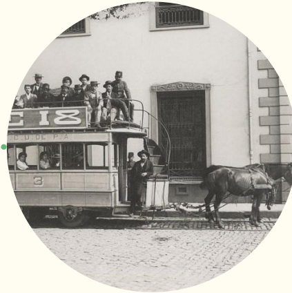
Carros de sangre de Valparaíso, hacia 1900.

Comienza a funcionar el Ferrocarril Urbano con carros de sangre.