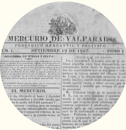
Primer número de El Mercurio de Valparaíso

12 de septiembre. Nace el diario El Mercurio de Valparaíso , que se imprime hasta el día de hoy.