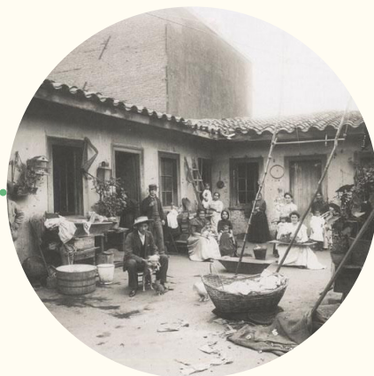
Conventillo, hacia 1900.

Se empiezan a construir conventillos en Valparaíso, haciendo visible la pobreza de una gran parte de la sociedad porteña.