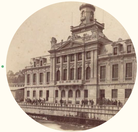
La Bolsa Comercial de Valparaíso , hacia 1880 .

Se inaugura la Bolsa Comercial de Valparaíso .