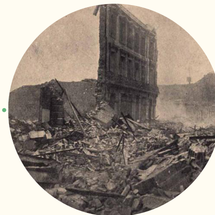
Calle Blanco esquina Edwards, tras el terremoto de 1906.

16 de agosto. Un fuerte terremoto destruyó casi completamente la ciudad.